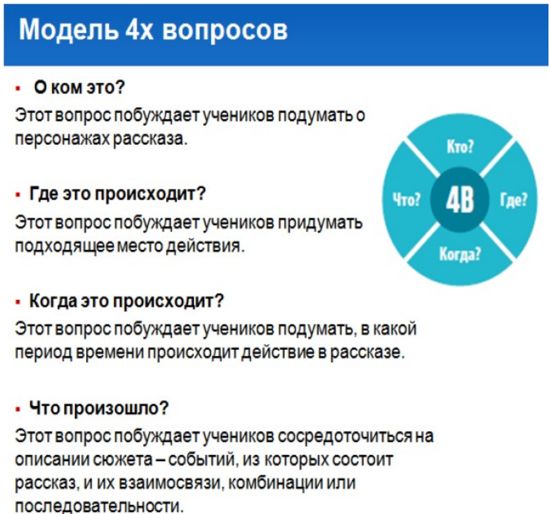
Рис. 2.1 Модель 4-х вопросов [34]

фильмы, книги, телевидение, ученики строят сценическую конструкцию, а затем разворачивается какая-то история на ее основе, обсуждаются разные точки зрения, учащиеся показывают свою трактовку событий, истории на видео становятся более обдуманными, учащиеся руководят процессом съемки и монтажа, вводятся элементы взаимооценивания работ (рис. 2.1).